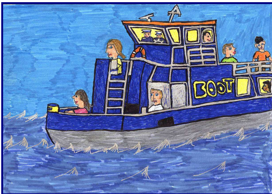
tekening gemaakt door Kevin Nepveu